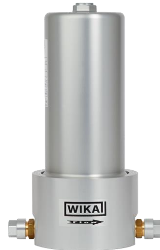
Переносная фильтровальная установка для элегаза модели GPF-10

Портативный компрессорный модуль для элегаза (SF 6 ) модели GTU-10; см. типовой лист SP 63.07