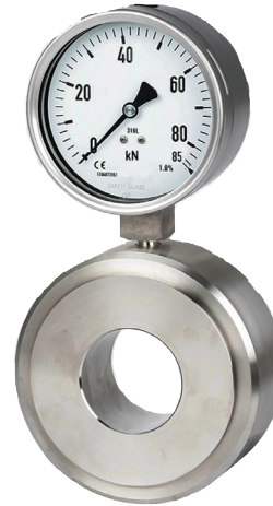
Hydraulischer Druckkraftaufnehmer, Typ F6198