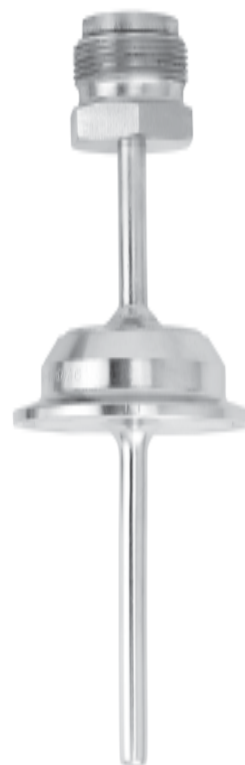
Защитная гильза с асептическим присоединением (скользящая гайка, внешняя). Модель TW65