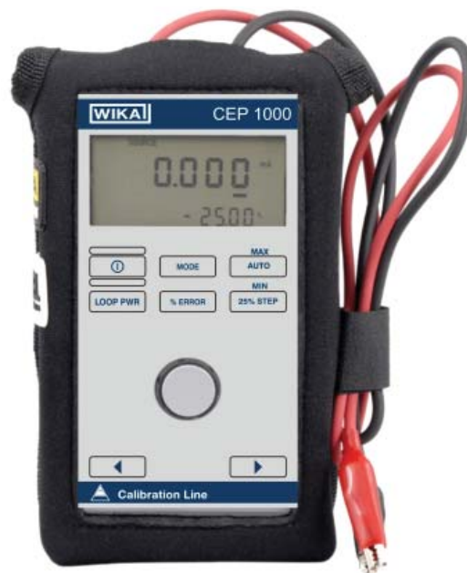
Высокоточный калибратор токовой цепи Модель CEP1000